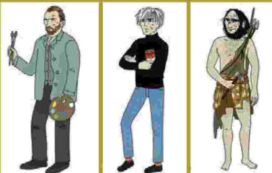
«Io dipingo di notte, e quando torno a studio il giorno dopo il delirio è finito» (Philip Guston)

U n progetto didattico, ideato e curato da Martina Fuga e Lidia Labianca di Artkids, prodotta da Nuova Villa Reale, Cultura Domani, con la collaborazione di ViDi, con il patrocinio del Comune di Monza e dell'associazione Famiglie al Museo, che si presenta come un vero e proprio viaggio temporale, dalla preistoria alla contemporaneità, in compagnia di alcuni grandi protagonisti della storia dell'arte. L'obiettivo è educare alla bellezza che l'uomo ha saputo creare in millenni di storia, mettendoli al centro di un racconto nel quale diventare protagonisti attraverso esperienze e riflessioni. Il percorso è suddiviso in stanze. I bambini saranno accolti da brevi filmati nei quali gli artisti (il «maestro» della grotta di Lascaux, Leonardo, Caravaggio, Monet, Van Gogh, Kandinskij, Warhol), disegnati dall'illustratrice Sabrina Ferrero in arte Burabacio, li introdurranno alla loro vita, alla loro arte e ai loro capolavori. Alla fine di ogni racconto i giovani visitatori saranno invitati a rielaborare i concetti che hanno visto e ascoltato dalla viva voce dei Maestri, in una serie di attività creative.