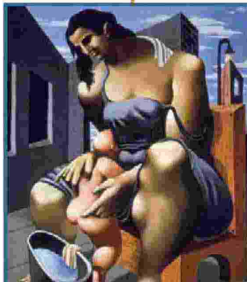
Dall'alto, Guston con «Mother and Child», «The Line» e «Painter's Form»

C ollateralmente alla cinquantasettesima Esposizione internazionale d'arte della Biennale di Venezia, dal 10 maggio al 3 settembre le Gallerie dell'Accademia di Venezia presentano il lavoro dell'americano Philip Guston (1913-1980) con una mostra che ne indaga l'opera attraverso un'interpretazione critico-letteraria: «Philip Guston and The Poets». Sono presi in esame cinque poeti del XX secolo che fecero da catalizzatori ai cinquant'anni della carriera artistica, con 50 dipinti considerati tra i suoi capolavori e 25 disegni dal 1930 fino al 1980, ultimo anno di vita dell'artista. Si tracciano così interessanti paralleli tra i temi umanistici riflessi nelle opere di Guston e il linguaggio di cinque poeti: D.H Lawrence, W.B. Yeats, Wallace Stevens, Eugenio Montale e T.S Eliot.