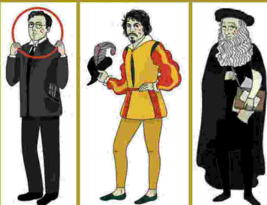
Sopra: le sagome di Vassily Kandinskij, Caravaggio, Leonardo. Sotto: quelle di Vincent Van Gogh, Andy Warhol e un uomo preistorico